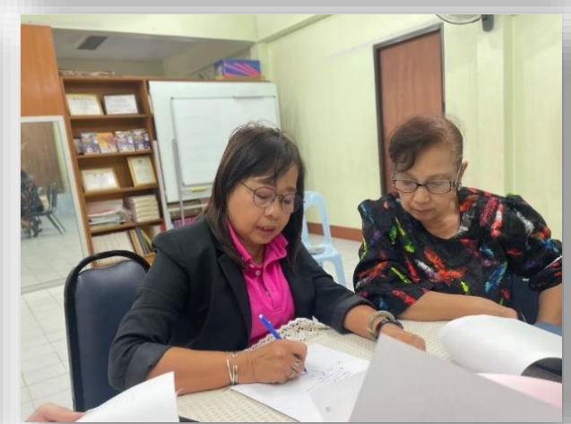
รายงานผลการดำเนินงานตามแผนปฏิบัติการ ประจำปีงบประมาณ พ.ศ.2566